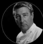
No. 2 Joan Roca El Celler de Can Roca Girona, Spanien