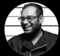
No. 5 Gaggan Anand Gaggan Bangkok, Thailand