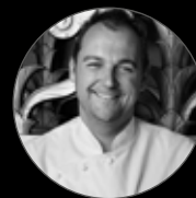
No. 4 Daniel Humm Eleven Madison Park New York, USA