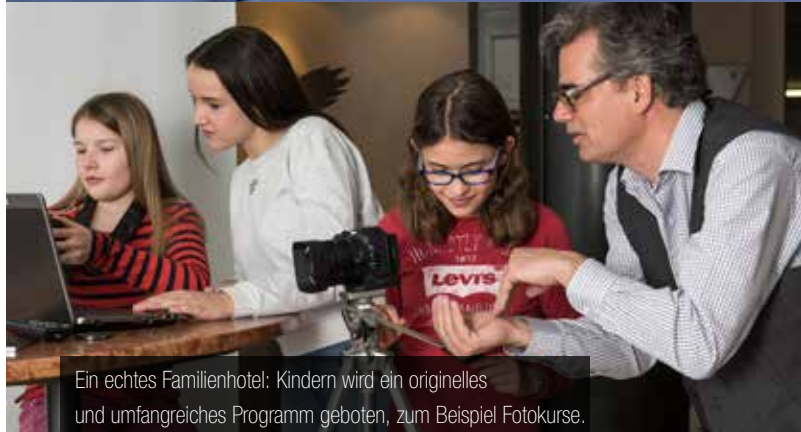
Ein echtes Familienhotel: Kindern wird ein originelles und umfangreiches Programm geboten, zum Beispiel Fotokurse.