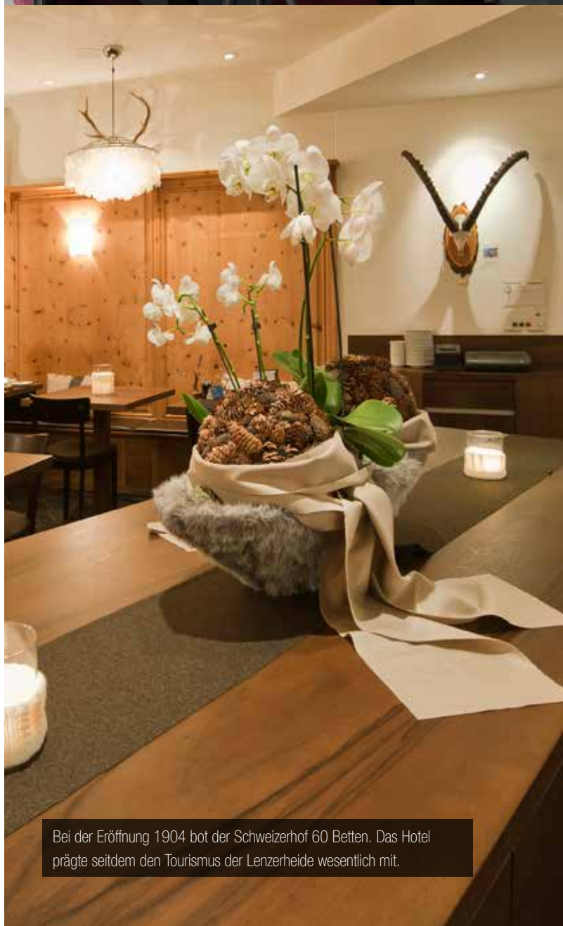
Bei der Eröffnung 1904 bot der Schweizerhof 60 Betten. Das Hotel prägte seitdem den Tourismus der Lenzerheide wesentlich mit.